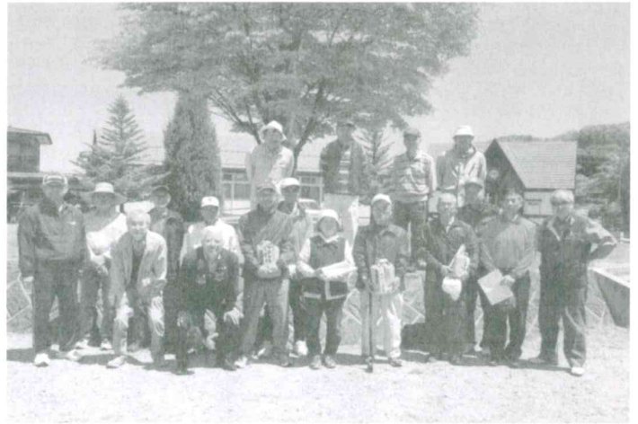
5月20日一日町「世代間交流グランドゴルフ大会」当日は子供たちが運動会のため参加できず、人数も少なめの状態でした。参加者 19名