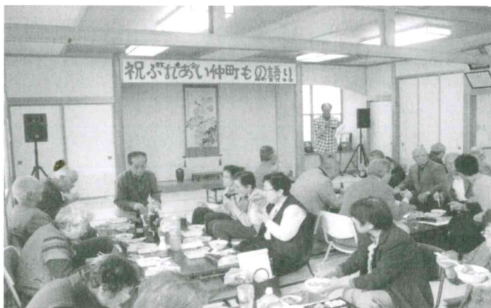
10月28日 仲町「ふれあい仲町もの語り」青壮年と福祉推進員で開催、赤十字防災セミナービンゴゲーム等実施、芋煮での会食を行った。参加者 26名