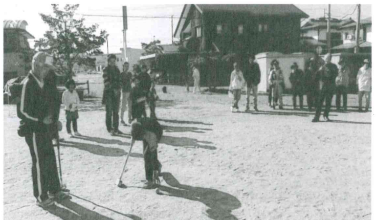
10月21日 上北目「世代間交流グランドゴルフ大会」長命会・一般・子供会と世代間の交流を図った。参加者 39名