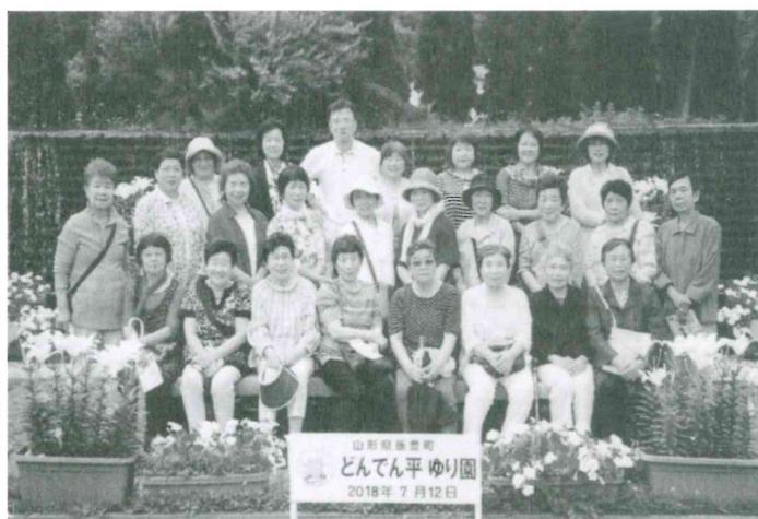
7月12日 下北目 「いきいきサロン」 (朝日町)甚平の棚田、日本の棚田百選ひとつと朝日ワイン城の歴史やどんでん平ゆり園など鑑賞し、参加者全員が感動し、楽しむことができました。参加者 25名