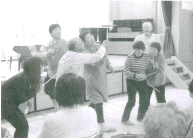
10月22日「第2回いきいき講座」第1部が健康講話と軽体操・第2部ポッキーマサによるマジックやジャクリングなどの大道芸、参加者による皿回し体験などで、楽しく過ごしました。参加者 55名