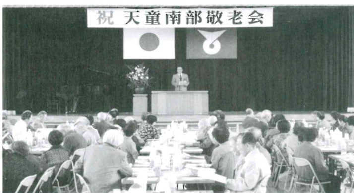
9月22日 「天童南部地区敬老会」が盛大に開催された。南部小児童の合唱や、優雅な踊り等を鑑賞し、楽しいひと時を過ごした。対象者 838名