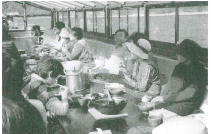
10月25日下北目「いきいきサロン」福祉推進部会が中心となり、町内会・楽友会の協力の下、新庄ふる里歴史センター・最上峡芭蕉ライン（最上川舟下り）を観光した。参加者 21名