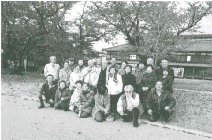
11月3日南町「いきいき活動視察研修」庄内映画村資料館、庄内で撮影された映画の室内セットや、衣装・ポスター等を視察した。参加者 24名